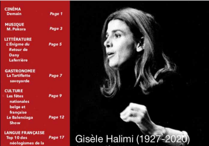
Gisèle Halimi (1927-2020)

¡Revista hecha por estudiantes y docentes UdeC! Le Fragnol, Bienvenue!