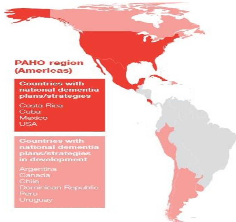
Countries with plans on dementia or in development in 2019